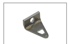
Giunti 90° con viti