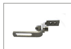
Kit staffa posteriore