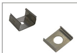
Clip di fissaggio