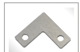
Kit staffe laterali