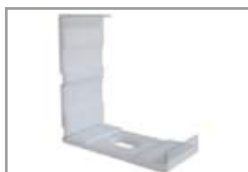
Graffa montaggio plastica