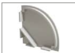
Tappo in plastica chiuso