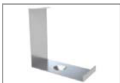
Graffa montaggio metallo