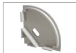
Tappo in plastica aperto