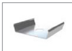
Graffa di montaggio