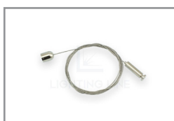
Kit di sospensione 1/2