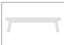
Diffusore opalino policarb.