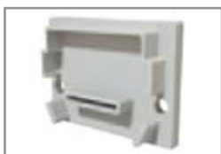
Tappo (Grigio, Bianco, Nero)

Profilo ad alta dissipazione in alluminio anodizzato argento o verniciato in RAL, ideale per alloggiare al proprio interno strisce LED flessibili. Lo scopo del profilo è quello di dissipare il calore, proteggere e dare un aspetto estetico più gradevole alle strip LED.