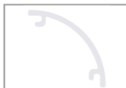
Diffusore PC satinato