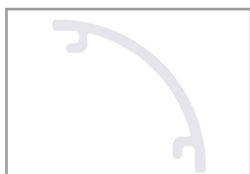
Diffusore PC trasparente