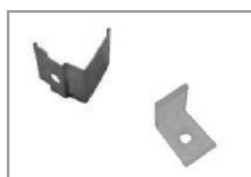
Clip di fissaggio